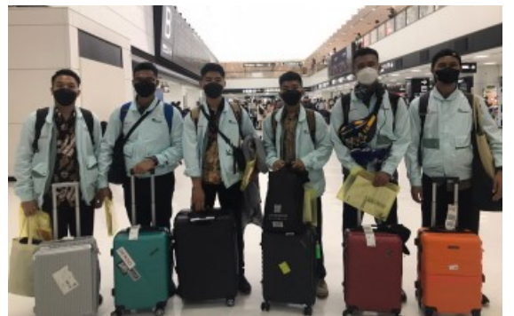
ねん がつ にち きゅうしゅう ↑ 2022年11月21日、(株)九州プレジジョンのインドネ じんぎのうじっしゅうせい めい にゅうこく シア人技能実習生6名が入国しました。