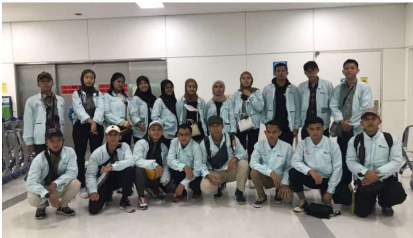
ねん がつ か じんぎのうじっしゅうせい めい ← 2022年11月14日にインドネシア人技能実習生19名が ぶじ にゅうこく 無事に入国できました。