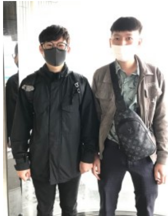
↑ 2022年9月7日に 入国した三栄荷役機械(株)のベトナム人技能実習生1名(右)が1カ月の講習を修了し、2022年10月7日に配属しました。