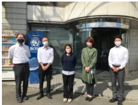
↑ 2022年9月11日に 入国した二之沢会1名フィリピン人技能実習生が1カ月の講習を修了し、2022年10月11日に配属しました。