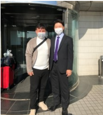
↑ 2022年9月21日に 入国した星光工業(株)技能実習生1名が1カ月の講習を修了し、2022年10月21日に配属しました。