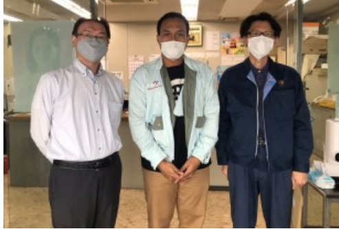
↑ 2022年9月7日に 入国した(有)友光合金鋳造所、1名のインドネシア人技能実習生(中)が1カ月の講習を修了し、2022年10月7日に配属しました。