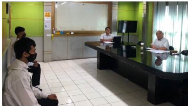
2022年10月2日に(有)友光合金鑄造所、インドネシア人技能実習生の代理選抜試験を実施しました。送出機関 WILIYANDIさん(左)、アジア産協戸名専務(右)。