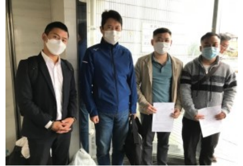
↑ 2022年9月7日に 入国したた児玉コンクリート工業(株)、ベトナム人技能実習生2名(右1、右2)が1カ月の講習を修了し、2022年10月7日に配属しました。