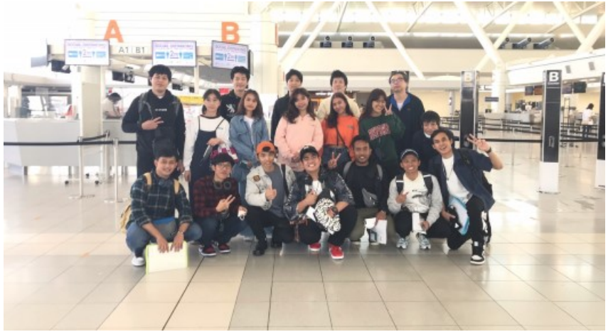
↑ 2022年5月10日にMICグループ、2019年10月19・22日に入国インドネシア人実習生13名が満了帰国しました。(株)九州メカニクス2名、(株)九州プレジジョン5名、(株)ケイ・エム・ケイ6名。