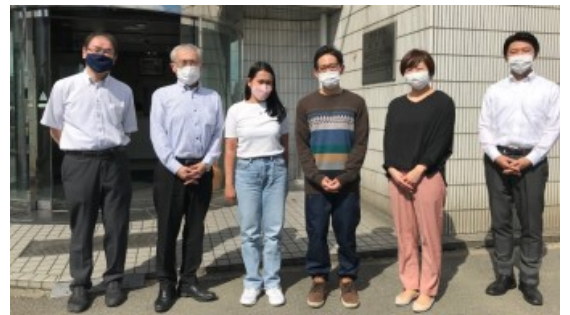
↑ 2022年9月11日に 入国した二之沢真福会1名フィリピン人技能実習生が1カ月の講習を修了し、2022年10月11日に配属しました。