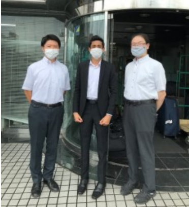
↑ 2022年8月9日に 入国した(株)セントラルシステム1名のスリランカ人技能実習生(中)が1カ月の講習を修了し、2022年9月8日に配属しました。