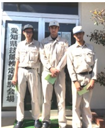
↑2022年10月17日～20日(株)竜製作所 インドネシア人技能実習生随時3級試験を受験しました。全員合格しました。