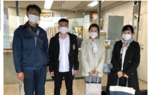
↑ 2022年9月7日に 入国した星光工業(株)1名ベトナム人技能実習生が1カ月の講習を修了し、2022年10月7日に配属しました。